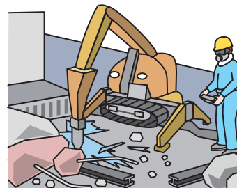
建物のコンクリート、ガラス、金属等