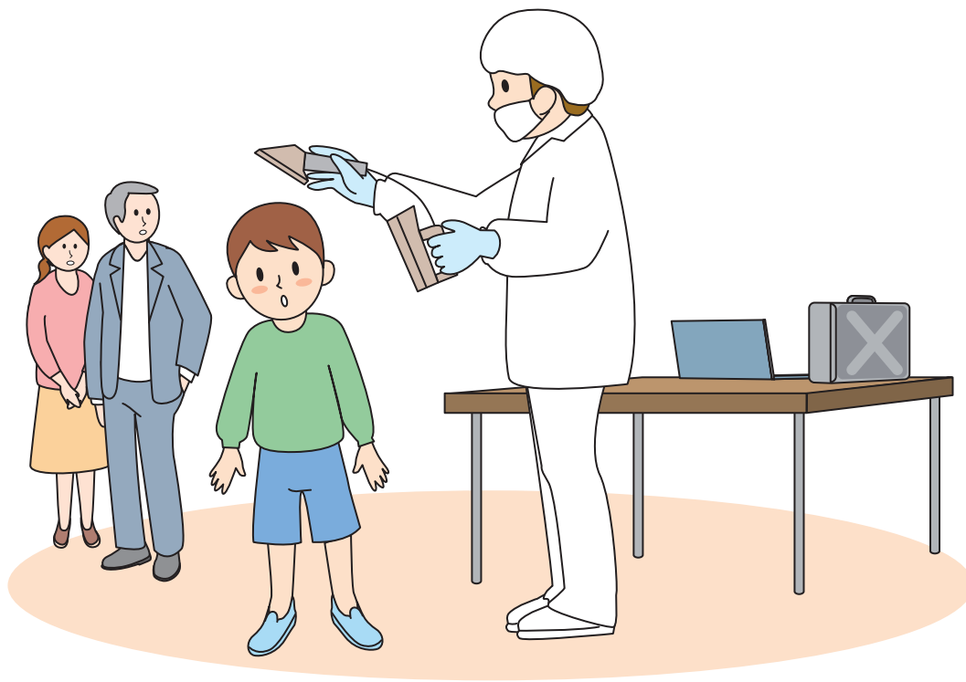
スクリーニング検査